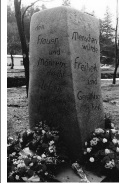
Mahnmal der verfolgten Sozialdemokraten (Einweihung April 1995)

Der SPD-AK Labertal und der SPD-Ortsverein Schierling laden ein zur Gedenkfahrt wider das Vergessen zur KZ-Gedenkstätte Flossenbürg am Samstag, 8. Mai 2010.